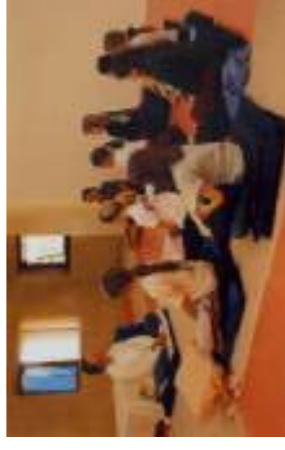
孩童都很喜欢学习静坐

葛印卡老师虽然备受尊崇，他却没有信徒，他总是强调要成为自己的主人，只能依靠自己。他以如此的精神教导所有学生：不论是成人或孩童都不例外。